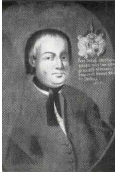
Joseph Kerschpämbler * 1687 – † 1756